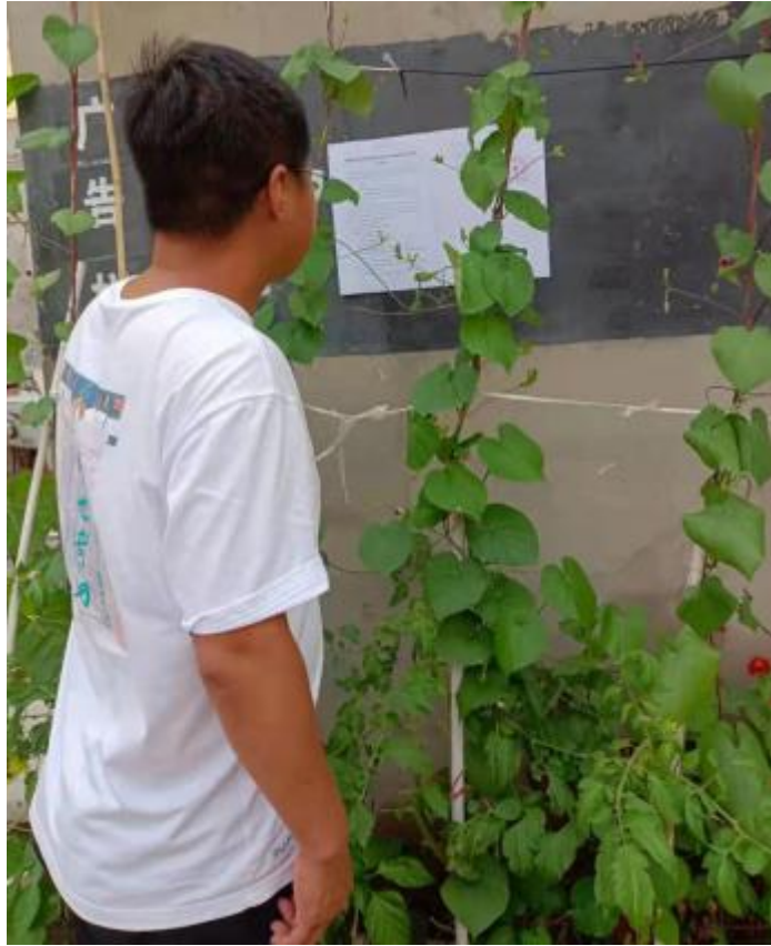
图 3.2-4 现场公示