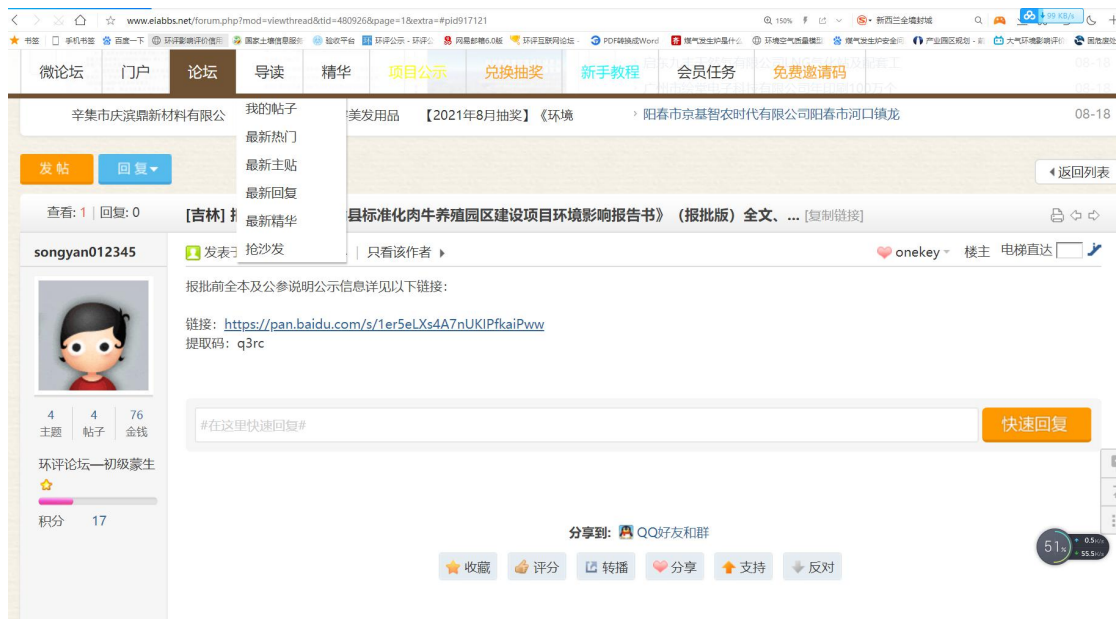
图 6.2-1 报批前公示