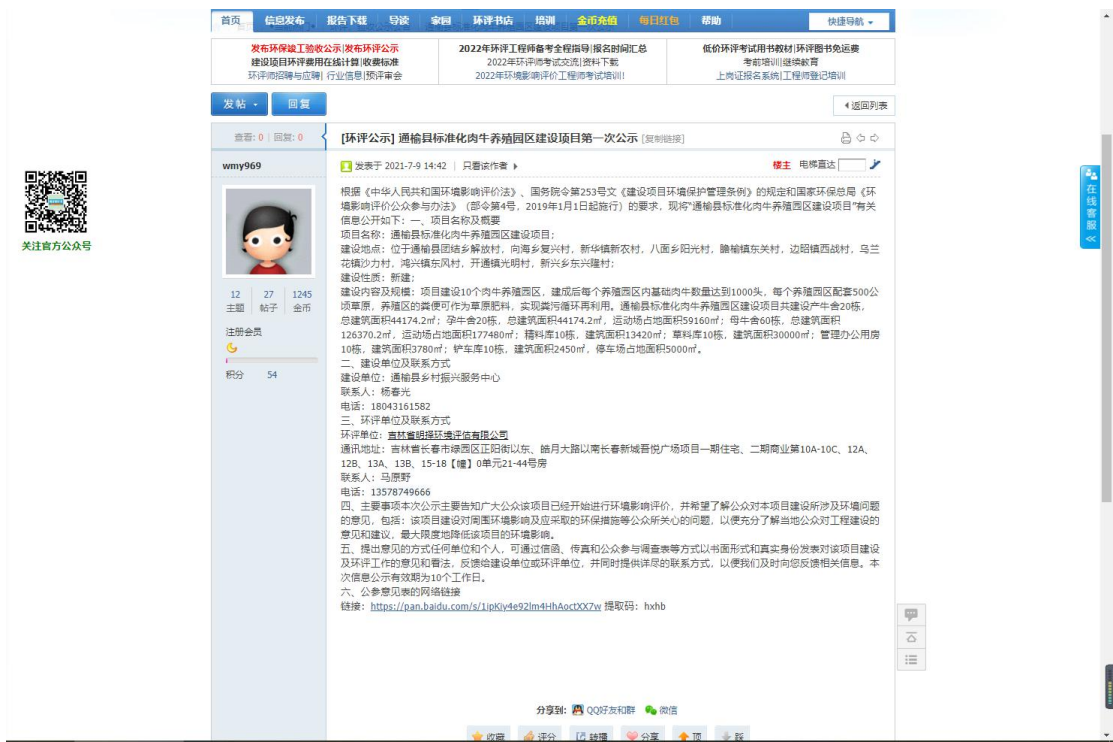
图 2-1 网页截图